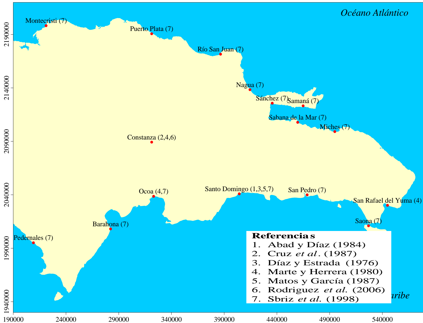
ESTACIONES DE MUESTREO DE COPS EN ALIMENTOS SEGÚN VARIAS FUENTES.